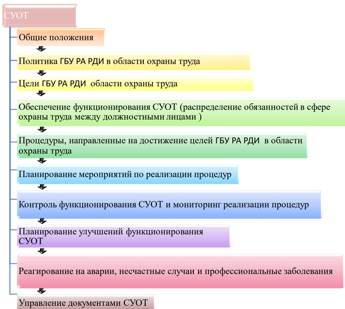
Рисунок 1 – Элементы системы управления охраной труда в ГБУ РА РДИ